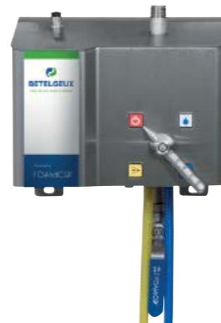
Satélite ULTRA Next

CONTRATO DE MANTENIMIENTO OPCIONAL con revisiones periódicas. 1 AÑO DE GARANTÍA