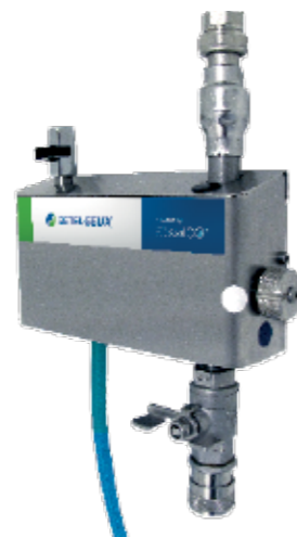
Satélite SU light 0125