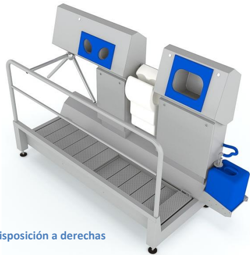
Disposición a derechas